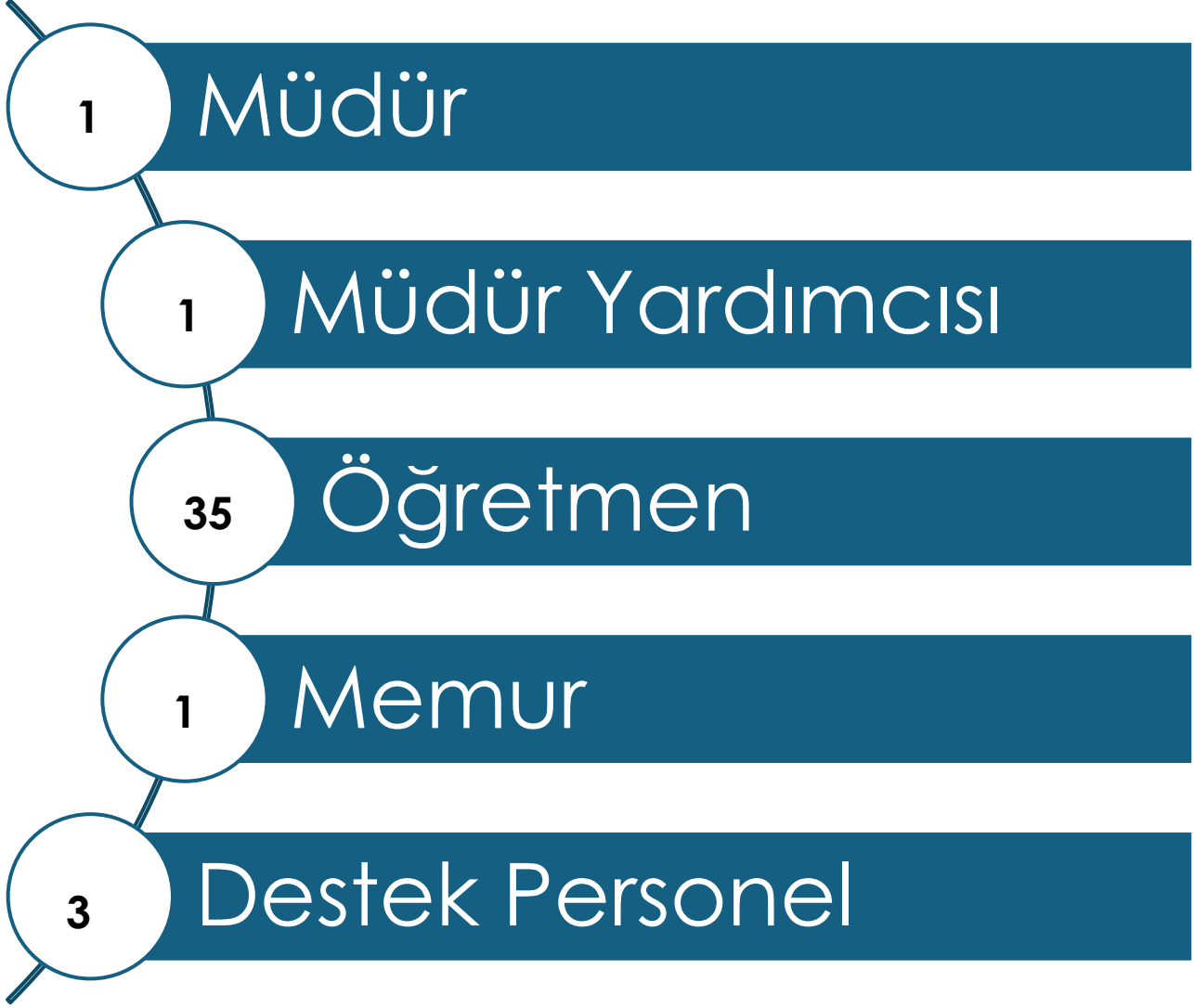
Şekil1: Teşkilat Şeması

Okulumuzun teşkilat yapısı aşağıdaki Şekil1’de gösterilmiştir.